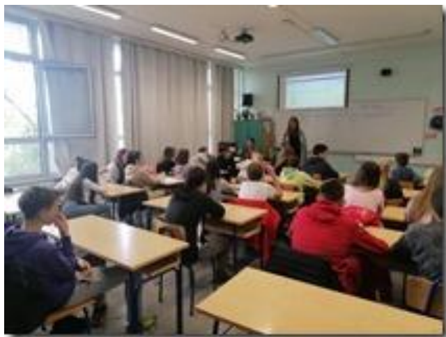
Slika 1. Radionica

Učenici u raspravi ističu pozitivne strane računalnog programa ChatGPT : besplatan je, dostupan svima, ima sposobnost vrlo dobre imitacije ljudskog sugovornika, uspješno prevodi te generira tekst u obliku eseja, pisma, pjesama i sličnoga.